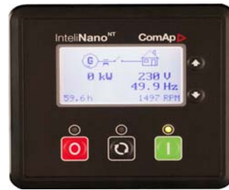
科迈 MRS3 智能控制器

具有自动、手动、关机（急停）等控制功能，丰富的可编程输出、输入接口及人性化界面，多功能液晶显示器，将检测的参数通过数据、符号、直条图显同时显示；ECU 支持（CAN J1939）；USB 接口