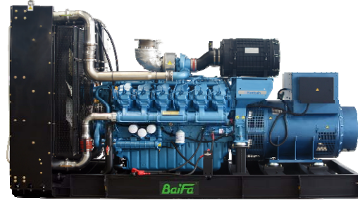
机组外形, 仅供参考