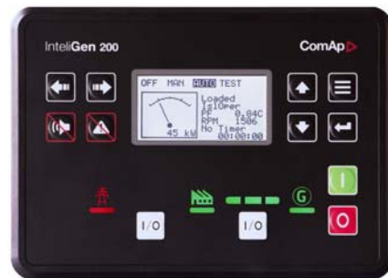
科迈 IG200 并机控制器

内置 AVRi；地理围栏和追踪；标配 USB, CAN 和 RS485 通讯口。