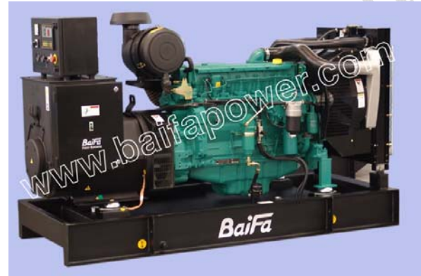
机组外形, 仅供参考